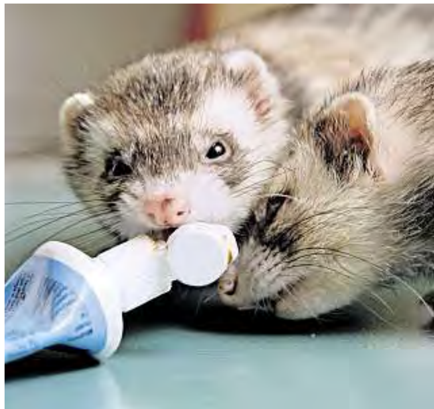
Les furets sont de gros dormeurs mais aussi de grands joueurs.

Pas étonnant lorsque l'on sait qu'en Suisse, pour détenir ce type d'animaux, il faut un permis délivré par le service vétérinaire cantonal pour une durée donnée et renouvelable. Dans d'autres pays comme les Etats-Unis ou la France, les furets sont devenus le troisième compagnon à poil après le chien et le chat. Passionnée par cet animal «intelligent, curieux, et qui dort beaucoup», la vétérinaire possède elle-même deux furettes: Hola , 7 ans et demi, et Lomé 5 ans et demi. «La première, nous sommes allés la chercher chez un éleveur, et la deuxième est arrivée devant la porte du cabinet dans un carton en pleine nuit... abandonnée», raconte la vétérinaire soulevant une problématique aux conséquences dramatiques: le grand nombre d'abandons qui touche ces animaux. «Quand on prend un animal, il faut penser à l'avenir, à sa durée de vie (cinq à huit ans pour les furets), à ses besoins quotidiens et à son éducation. Parfois, il vaut mieux choisir une bête qui vit moins longtemps et qui est peu encombrante plutôt qu'un animal exigeant.» Car si la loi sur les animaux domestiques est stricte en Suisse, c'est aussi pour éviter que