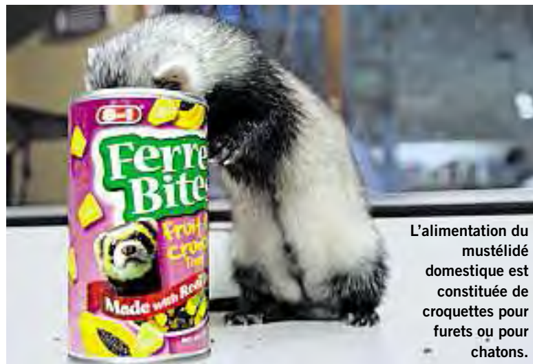
L'alimentation du mustélide domestique est constituée de croquettes pour furets ou pour chatons.